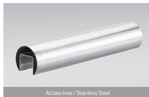
Acciaio Inox / Stainless Steel